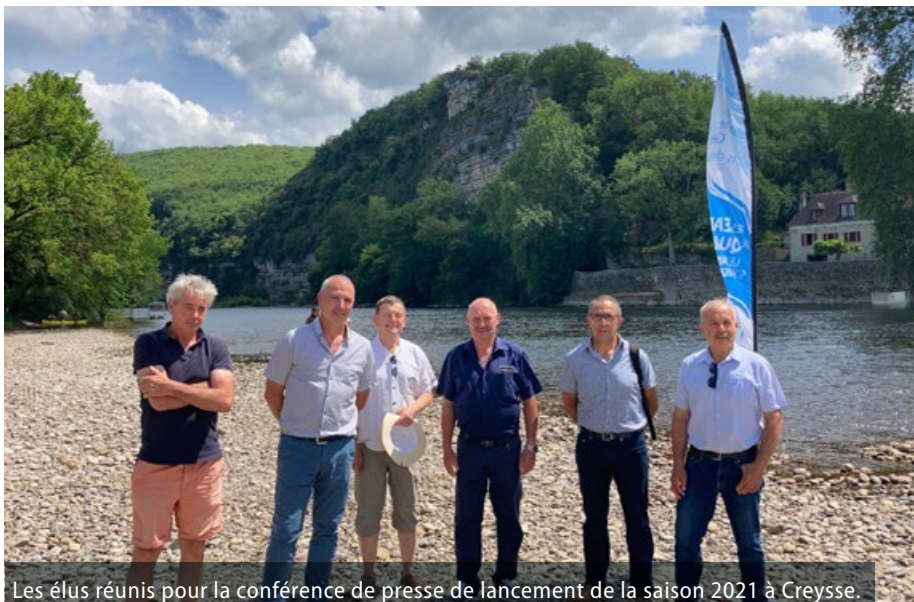
Les élus réunis pour la conférence de presse de lancement de la saison 2021 à Creysse.

Sur la Dordogne, de nombreuses baignades non officielles étaient fréquentées depuis longtemps par les habitants et les touristes. Le Syded a incité les communes à faire recenser ces zones pour bénéficier d'un accompagnement complet (profil de baignade, prévisions quotidiennes en période estivale, communication réglementaire...) Les communes de Lacave, Creysse et Montvalent font donc désormais partie des baignades officielles.