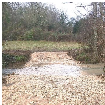
Passage à gué empierré