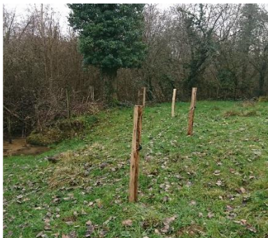
Clôture type « Gallagher »