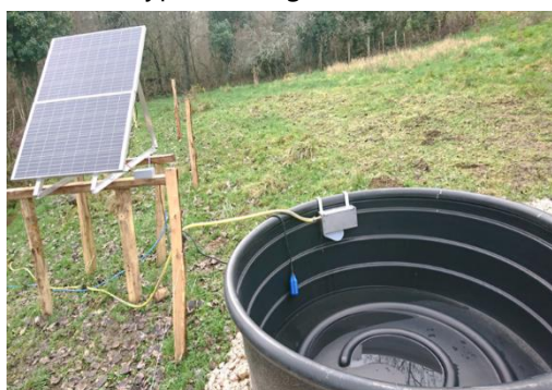
Abreuvoir fixe solaire