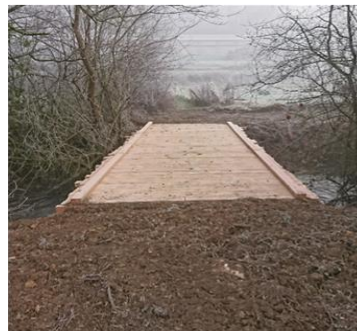
Passerelle bétails en bois